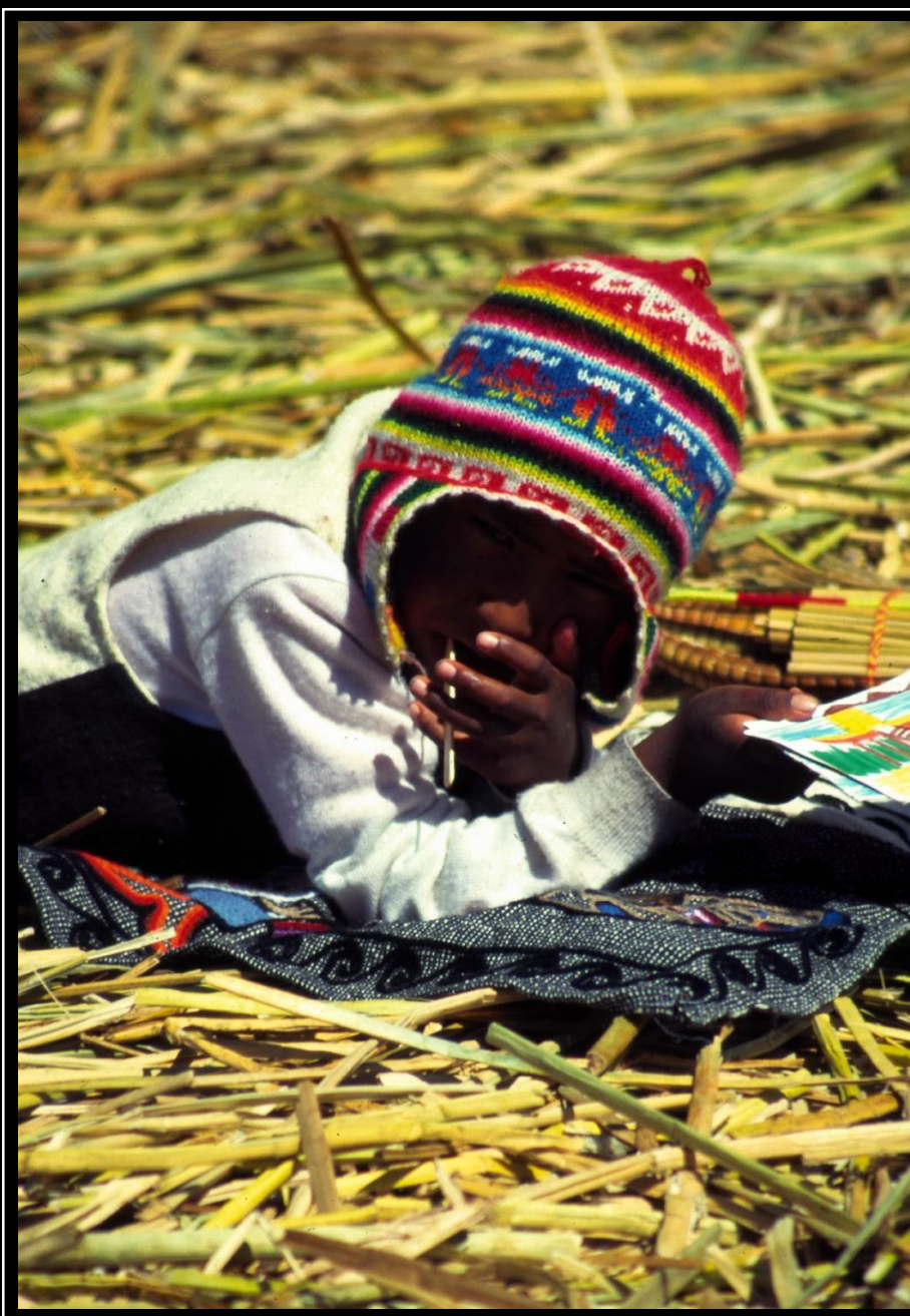
☺ Nimm es leicht und gelassen. Es gibt selten Grund zur Eile. ☺ Junge mit bunter Wohlmütze erholt sich auf der Schilfinsel Uru im Titicacasee (Bolivien) – August 1996